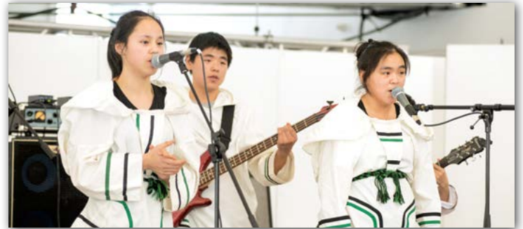
Interprètes culturels de TNQ aux Jeux de 2016 à Nuuk, au Groenland.

D'abord, ÉNQ est à la recherche d'interprètes culturels et pour ce faire, un appel de candidatures est en cours du 1 er juillet au 22 septembre. La délégation culturelle sera formée de trois à six jeunes artistes talentueux, mais non professionnels, âgés de 14 à 20 ans, soit des chanteurs, des danseurs, des interprètes de chant guttural ou des musiciens. La délégation culturelle représentera ÉNQ à divers spectacles et cérémonies publics lors des Jeux d'hiver de l'Arctique 2018. La sélection finale des interprètes culturels sera annoncée sur la page Facebook d'ÉNQ et sur le site Web de l'ARK plus tard dans l'année.