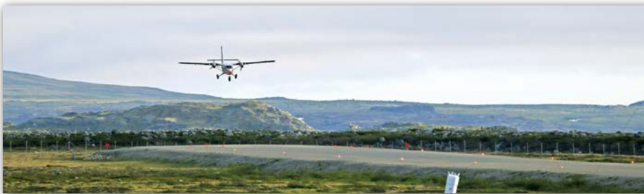
Des travaux de rechargement de la piste seront effectués dans plusieurs communautés en 2017.

À l'assemblée de mai du Conseil de l'ARK à Umiujaq, le ministère des Transports du Québec (MTQ) a fait une présentation générale sur les projets récents, en cours et à venir concernant les infrastructures aéroportuaires de la région.