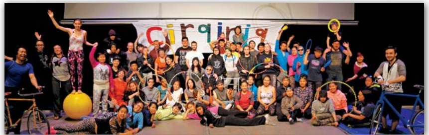
Photo de groupe des participants du camp d'été Cirqiniq de cette année à Kuujuaq.