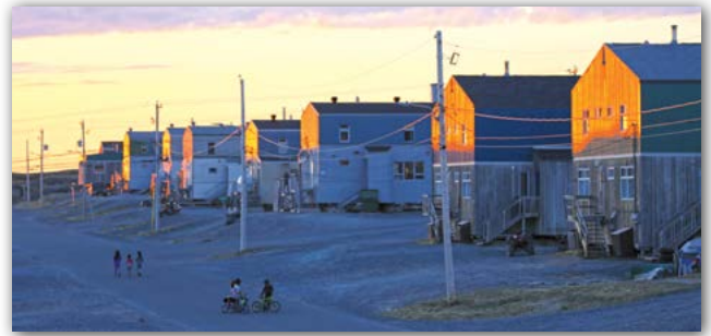
Logements à Umiujaq, communauté sur la côte d'Hudson.

Lors du dernier Conseil à Umiujaq du 29 mai au 1 er juin, les élus municipaux ont alloué 66 unités d'habitations réparties dans six communautés, comme l'indique le tableau ci-contre.