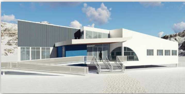
Le futur bureau municipal du village nordique de Kangiqsujuaq.

Le Service des travaux publics municipaux supervisera également les rénovations complètes des centres de la petite enfance situés à Kuujjuaq, à Kuujjuaraapik et à Inukjuak. Ces projets de rénovation sont nécessaires afin de moderniser les bâtiments et ils sont payés par l'ARK, par l'entremise de son programme de services de garde à l'enfance.